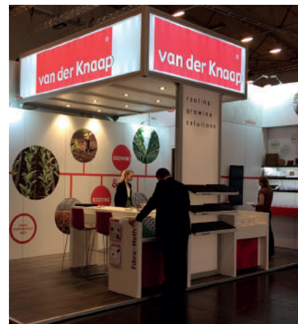
Stand Van der Knaap Groep auf der IPM

22. bis 25. Januar 2019 statt. Und Van der Knaap wird natürlich wieder dabei sein!