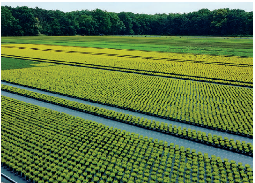
Wustmans beschikt over een containerveld van 9 ha