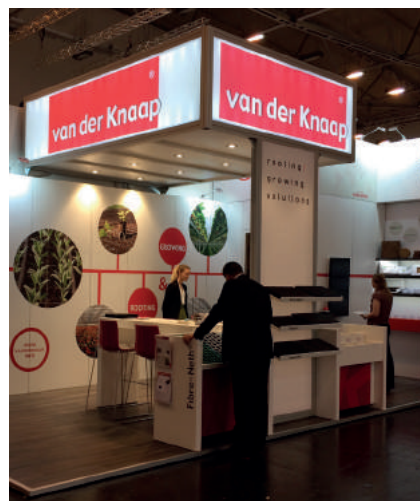
Stand Van der Knaap Groep op IPM

Van der Knaap is van plan weer deel te nemen!